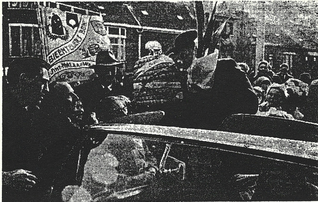
Biemannen uit het Waasland verwelkomen een vroegere vriend, bijenliefhebb en vroeger lid der Afdeling; bij zijn aanstelling als Pastoor van de paroch Christus-Koning te St. Niklaas

WIE IN HET DAL BLIJFT ZIET NOOIT DE ANDERE KANT VAN DE BERG. ENGELS spreekwoord